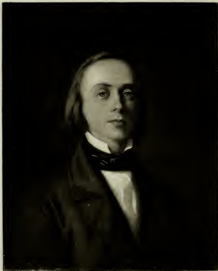
W. Streckfuss pinxit 1855.